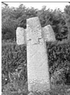
"Croix de Kerleven"

Datant du Moyen-Age, cette croix en granit mesure 2 mètres. Croix monolithe - Branches courtes pattées Croix en relief, grecque sur la face, latine sur le revers - Traces d'usure à la naissance des bras. Anciennement située à Kérailis.