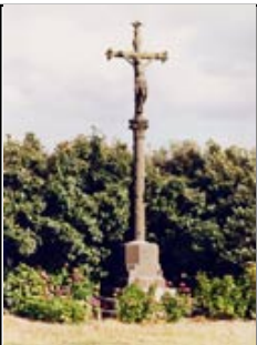
Croix de Mission"

- Datant de 1882, cette croix en granit se situe en haut de la Côte du Salut et mesure 5 mètres. Trois degrés - Socle biseauté mission 1882. Fût rond - Ecots - Chapiteau - Croix à fleurons - Crucifix -Erigée en 1978, grâce aux habitants de Dourmap et de Kerdives - Socle de l'ancienne croix : mission 1922. Elle se situait à l'origine dans le cimetière près de l'église Saint Didier.