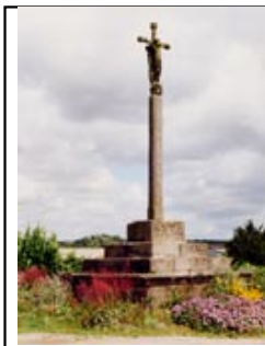
"Croix de Kergoff Bras"

Datant de 1617, cette croix en granit mesure 5 mètres. Trois degrés - Corniche - Socle - Fût - Ecu au calice PM 1617 - Croix, fleurons, boules - Cricifix - Evêque. La carte IGN la signale, gardant aussi la mention de l'ancien emplacement.