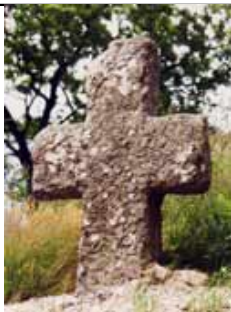
"Croix de Lestevennoc"

Croix en granite de 0,90 m. avec macé, représentant le Christ sur la Croix. Tournée vers l'Ouest comme les menhirs - Située près des propriétés Ollivier. Trois degrés - Corniche - Socle - Fût - Ecu au calice PM 1617 - Croix, fleurons, boules - Cricifix - Evêque. La carte IGN la signale, gardant aussi la mention de l'ancien emplacement.