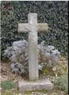
"Croas ar Boulvas"

Datant de 1836, cette croix en granit mesure 1,70 mètre. Soubassement - Socle cubique - Croix à pans - Crucifix vers la voie.