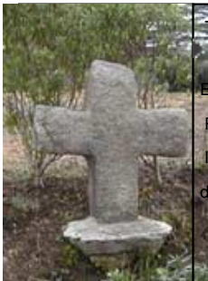
"Croix de Runéven"

Datant du moyen-Age, cette croix patté en granit mesure 1,70 m. Elle porte sur sa face une longue épée gravée en creux, qui rappelle selon la tradition, qu'à cet endroit s'est déroulée la bataille du comte Even le Grand contre les Normands. Revenu d'Angleterre avec le duc de Bretagne Alain Barbetorte, Even est chargé par le souverain de chasser les envahisseurs hors du Léon. Il s'établit à Lesneven, au centre du territoire qui lui est dévolu, et y construit une enceinte fortifiée. Le nom même du lieu, Runéven, colline d'Even, évoque ce combat, et plusieurs autres croix similaires jalonnent les alentours de Lesneven.