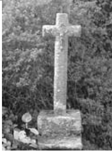
"Croix de Kermabon"

Datant du 17ème siècle, cette croix en granit mesure 3 mètres. Elle se situe près du lavoir, sur la fontaine. Soubassement composé par le tableau du bassin, large pierre rectangulaire débordante. Socle cubique