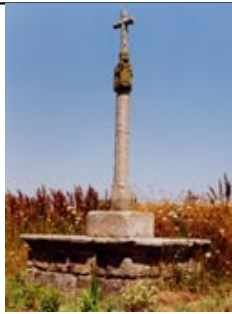
"Croix de Brondusval"

Datant de 1562, cette croix en granit mesure 4 mètres. Soubassement à trois degrés disloqués - Socle cubique - Fûts à pans et griffes - Sommet composé de trois personnages adossés : Saint Yves, Saint Fiacre, autre saint. Inscription sur quatre lignes horizontales et verticales : 1562 Y (Person) PEZRON. MA. MENS. SA FA- E (sa femme). Monument situé à une hauteur, en partie mutilé.