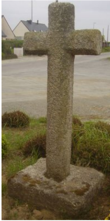
arrière de la croix